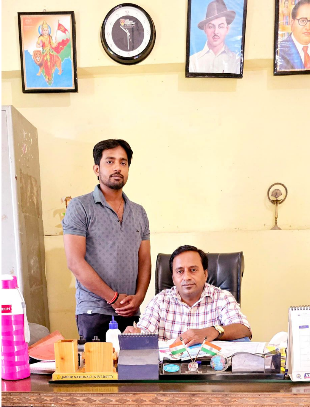
Lata Deep Inter High School, Bareilly